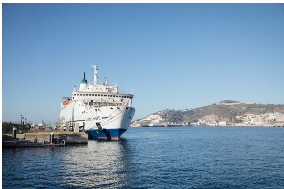
Die Logos Hope wird vom 4.-14. Juni in Hamburg sein

Für alle, die im Ruhestand sind, und sich fragen, welche Rolle sie in dieser Lebensphase mit ihrer Erfahrung und Weisheit in ihrem Umfeld, der Kirche und im Reich Gottes spielen können, laden wir ein zum Event ‚ Berufen im (Un)Ruhestand ‘ am 10. Juni um 15:00 Uhr. (Fortsetzung nächste Seite)