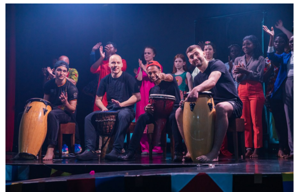
Beim Event ‚Meet the World‘ werden die Kulturen auf dem Schiff gefeiert