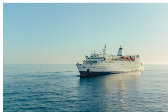
Das OM-Schiff Logos Hope